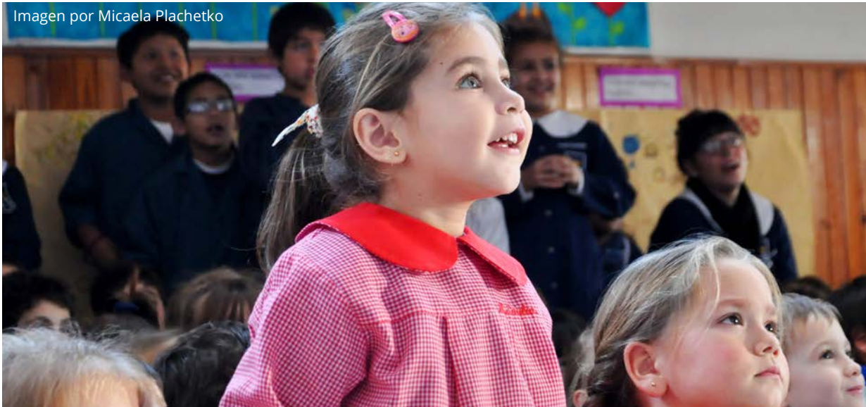
Imagen por Micaela Plachetko

Los Socios comerciales deben garantizar que su uso de la tecnología de la información y los sistemas de Pearson no exponga a la empresa a riesgos de seguridad o violaciones de confidencialidad, reclamaciones judiciales, sabotajes, virus o problemas similares. En particular, los Socios comerciales deben: