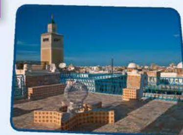
Tunis, en Tunisie