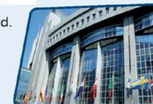
Bruxelles, en Belgique