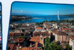
Genève, en Suisse